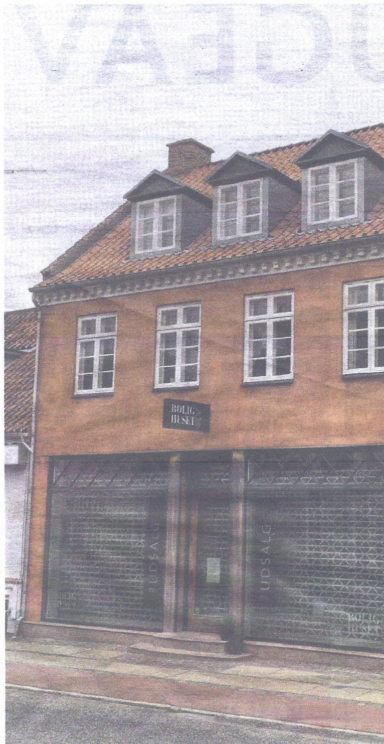
Der bliver spekuleret i, hvad bygningen, der tidligere rummede Bolighuset, skal bli

- I første omgang har vi fået lov til at låne Bolighuset til en udstilling med lokale kunstnere, og beliggenheden midt i Ry i det smukke gamle hus ville danne en fantastisk