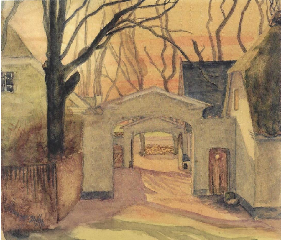
Stensgaard 25.1.1919. Akvarel, 22,5x27 cm.